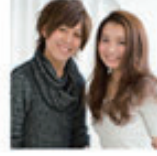
MODEL: 会社員 (ブロッサム歴 1年 / 25歳) STYLIST: ひばりヶ丘店 大田 歩

ゆるいパーマを毛先にかけて気取らないラフなロングスタイルに仕上げました。大胆なサイドの分け目を自然にかき上げ、ソフトワックスで揉み込むだけでふんわり女性らしいスタイルに。春らしいふんわりパーマをかけたい方にオススメです。