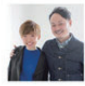
MODEL: 会社員 (ブロッサム歴 8年 / 27歳) STYLIST: 川越クレアモール店 肥沼 和重

トップにボリュームを出して、コンパクトで女性らしいスタイルに。ふんわり&スッキリの黄金バランスで小顔効果アップ。明るめのカラーが柔らかな印象にしてくれます。オシャレにショートを楽しみたい方にオススメです。