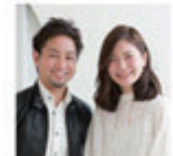
MODEL: 会社員 (ブロッサム歴 5年 / 27歳) STYLIST: ひばりヶ丘店 久間 優

ゆったりしたパーマを顔まわりにかけ、明るすぎないブラウン系のカラーでふんわりツヤのある上品なミディアムスタイルに。柔らかいクリームトリートメントのスタイリング剤で自然な質感を出しています。エレガントなイメージにしたい方にオススメです。