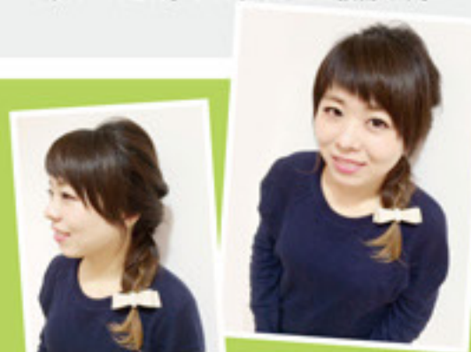
女性らしいかわいいスタイルが得意です。ぜひお店に遊びに来てくださいね。

1 ハチの上をとり、一つに結んだ中に結んだ先を入れます。通称「くるりんぱ」!最後に襟足も「くるりんぱ」!ここまで、三つの「くるりんぱ」が完成します。 2 耳の上を同じようにとって「くるりんぱ」!最後に襟足も「くるりんぱ」!ここまで、三つの「くるりんぱ」が完成します。 3 1の「くるりんぱ」を2つめに入れ込み、2つめを三つめに入れ、一つの束にします。その毛先を三つ編みにしていきます。 4 毛先まで三つ編みにして、少し崩します。 完成! 軽くスプレーをして整えたら完成です!リボンやバレッタなど洋服に合わせてアレンジするとかわいいですよ。ぜひチャレンジしてください。