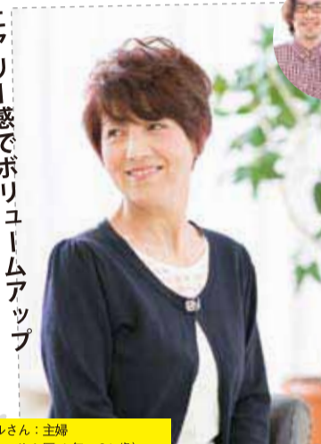
モデルさん：主婦 (ブロッサム歴4年 61歳) 担当：若葉店 菅原 望