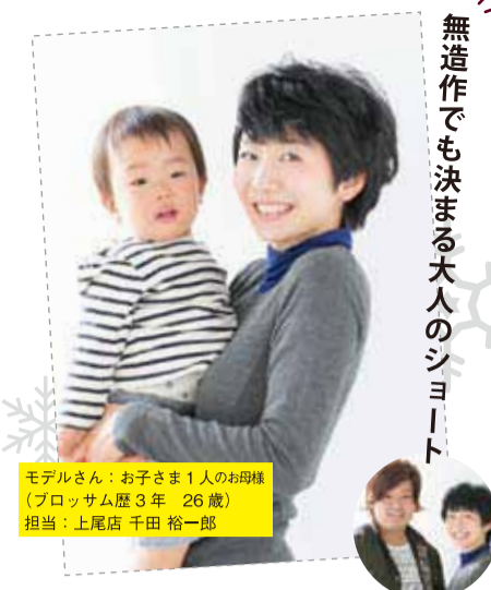
モデルさん：お子さま1人のお母様 (ブロッサム歴3年 26歳) 担当：上尾店 千田 裕一郎