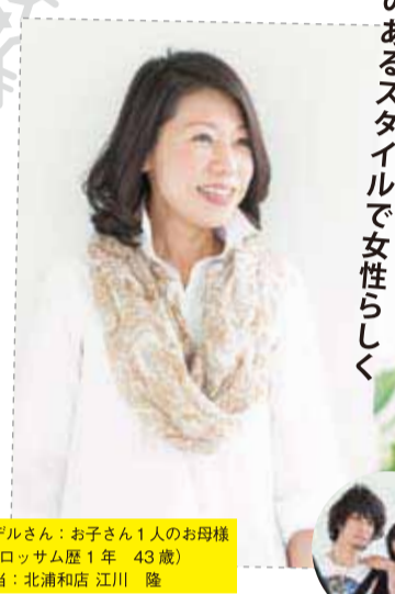
モデルさん：お子さん1人のお母様 (ブロッサム歴1年 43歳) 担当：北浦和店 江川 隆